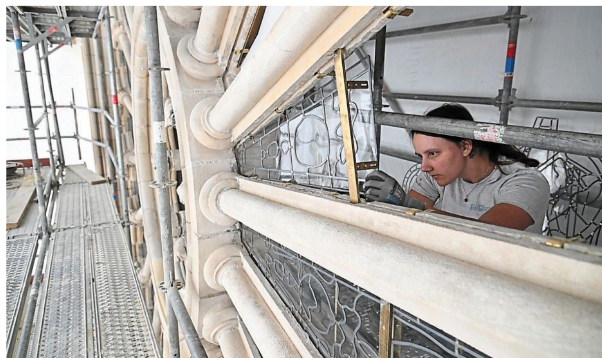
Une verrière de doublage est posée à l'extérieur pour protéger durablement et discrètement les vitraux de la rose.