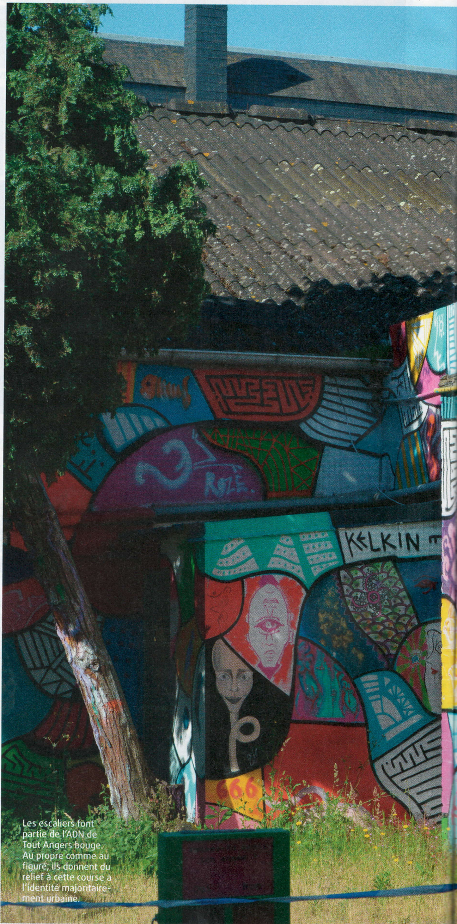
Les escaliers font partie de l'ADN de Tout Angers bouge. Au propre comme au figuré, ils donnent du relief à cette course à l'identité majoritairement urbaine.

Mais une fois qu'on s'est mis ça en tête et que nos instincts les plus montagnards ont été placés en pause, ce Tout Angers bouge, qui fêtait sa 10 e édition cette année, est un vrai bonheur, surtout quand on ignorait tout de la ville jusqu'à présent. Les organisateurs ont en effet l'art de dénicher des parcours originaux qui permettent de jouer les explorateurs urbains. Alors oui, il y a les dernières centaines de mètres qui se font à l'ombre du fameux château de la ville, imposant symbole de pierre, mais dans la grande tradition du trail urbain, c'est loin d'être la seule surprise qui →